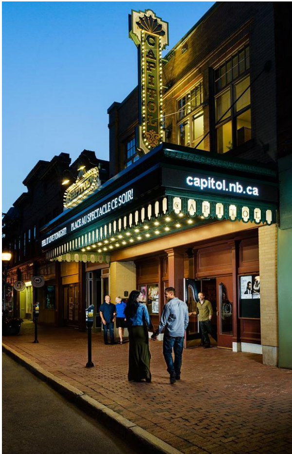
Le théâtre Capitol, rue Main à Moncton, construit d'après les plans de René-Arthur Fréchet.

est sans doute la chapelle du mémorial de Grand-Pré en Nouvelle-Écosse. Étant donné que le site a été reconnu comme patrimoine mondial de l'Unesco, la gloire de cette reconnaissance rejaillit un peu sur René-Arthur Fréchet.