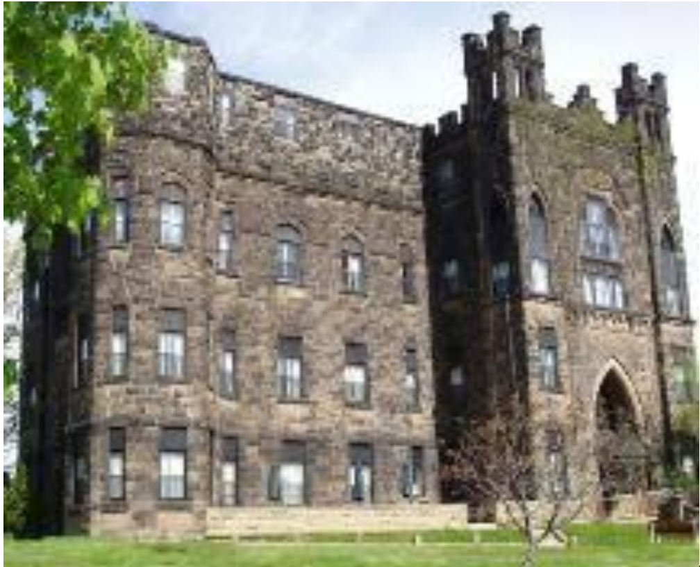
Le Château Bel-Âge, coin Archibald et Mountain à Moncton, 220 rue de l'Université, à proximité du Centre hospitalier universitaire Georges-L.-Dumont. Le parc en face du Château honore maintenant la mémoire de René-Arthur Fréchet.

« Cette structure néogothique entreprise en 1906 et achevée en 1908 a un cachet à la fois séculier et religieux. Les éléments extérieurs qui captent l'attention sont les pierres franches grises extraites de la carrière Notre-Dame, la grande tourelle au coin sud-est